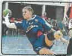
ktoré s domácimi hráčkami prehrali 26:32 a 21:37.